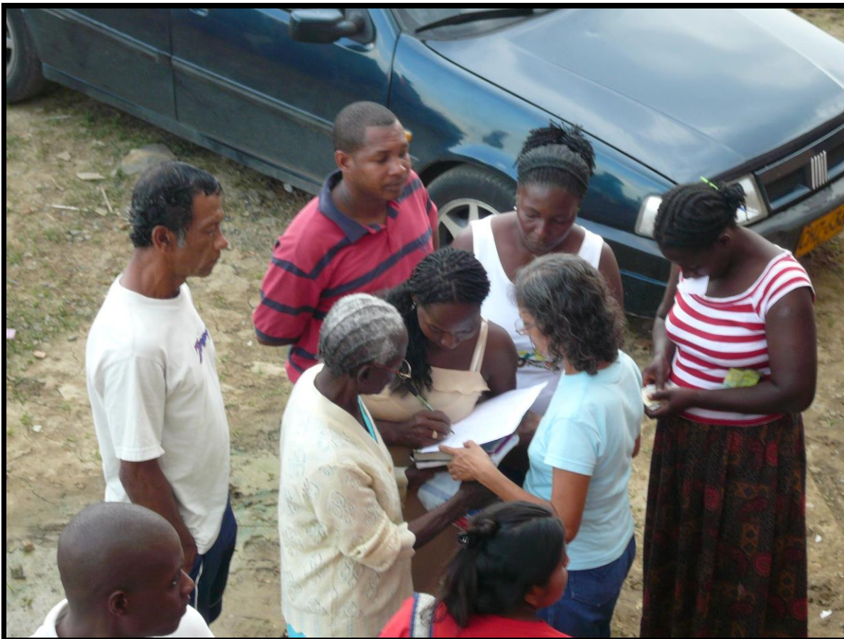
Foto No. 3 Visita a desplazados en Potrero Grande