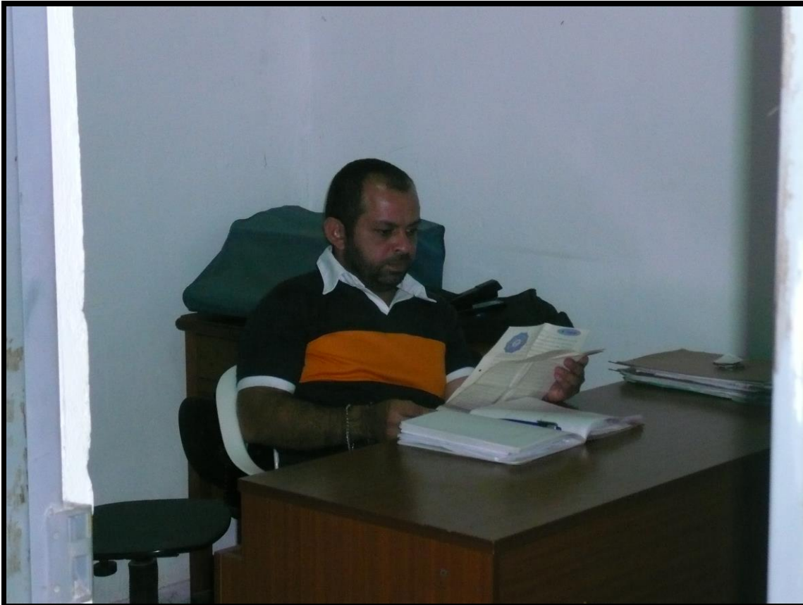
Foto No. 9 estudio de caso en SOLIVIDA para conciliación

Los servicios de conciliación para los casos de conflictos menores que se presentan entre miembros de una familia, o entre población desplazada o entre población desplazada y población receptora, se prestaron en las instalaciones de SOLIVIDA.