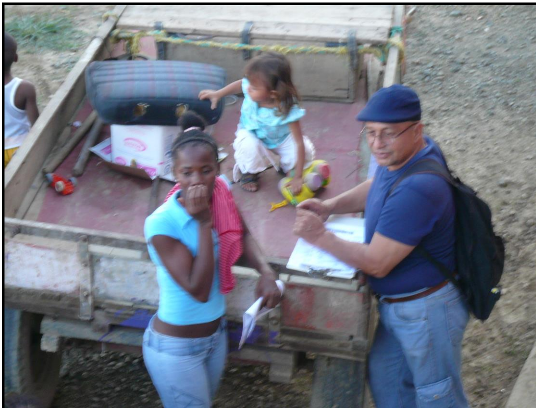
Foto No. 11 intervención sicosocial de población desplazada