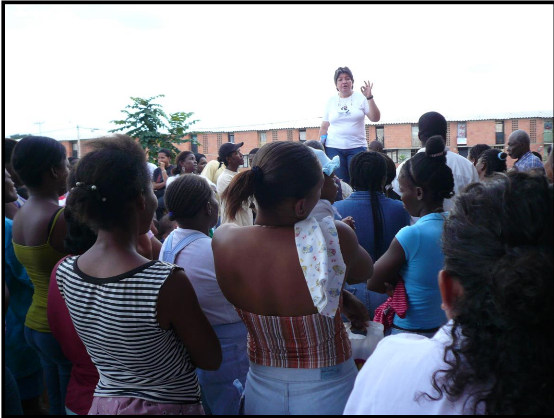
Foto No. 6 en reunión con desplazados en el sector de Potrero Grande – Comuna 21