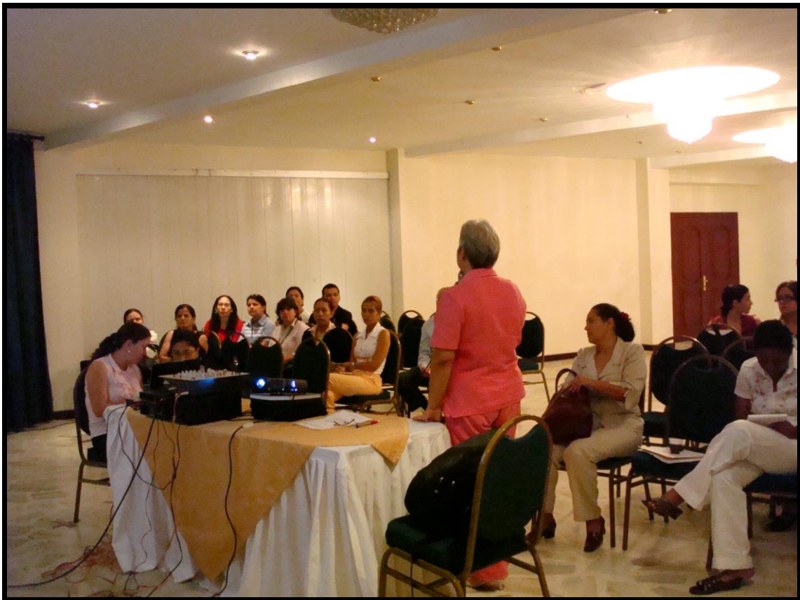
Foto No. 2 reunión comité Salud y Desplazamiento – Diciembre 19 de 2007