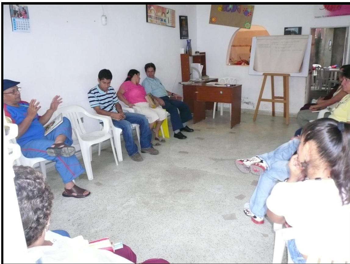
Foto No. 13 Taller con gestores locales en SOLIVIDA

Se hicieron dos talleres de capacitación con gestores locales que son personas de organizaciones de desplazados, organizaciones sociales, comunitarias y personas que prestan apoyo a la población desplazada. Teniendo en cuenta las necesidades de la población desplazada