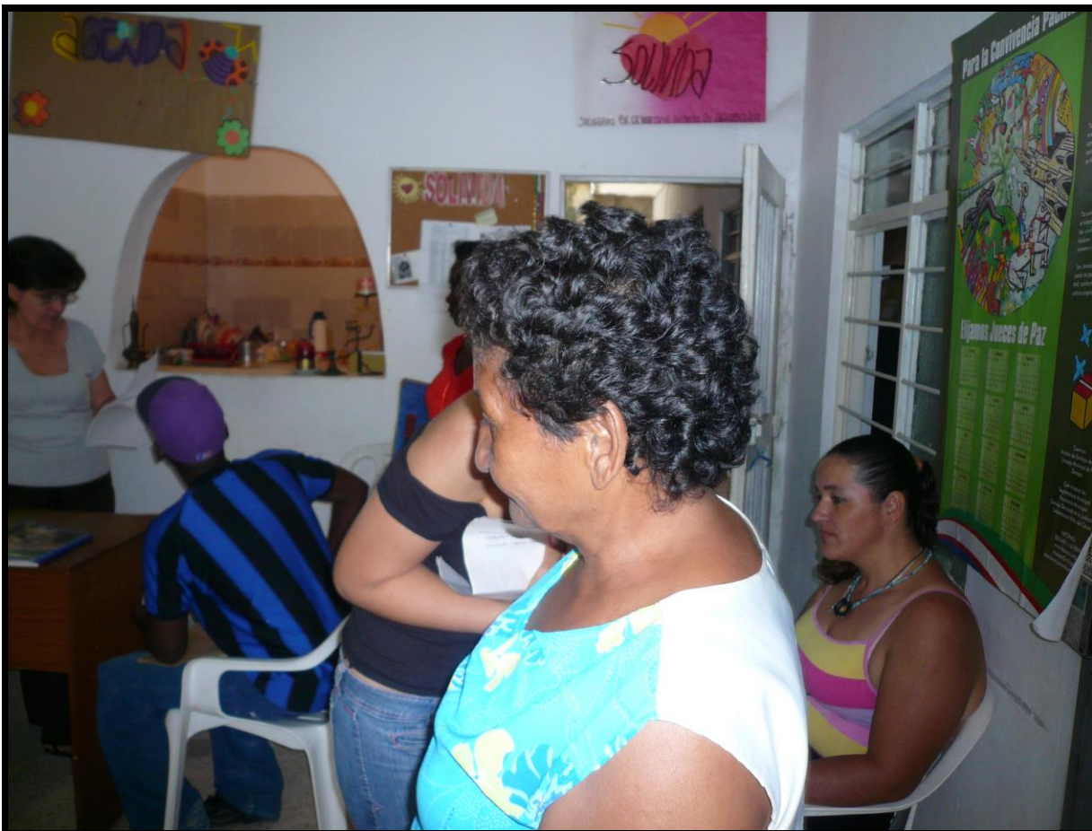
Foto No. 1 Mujer desplazada esperando atención en SOLIVDA