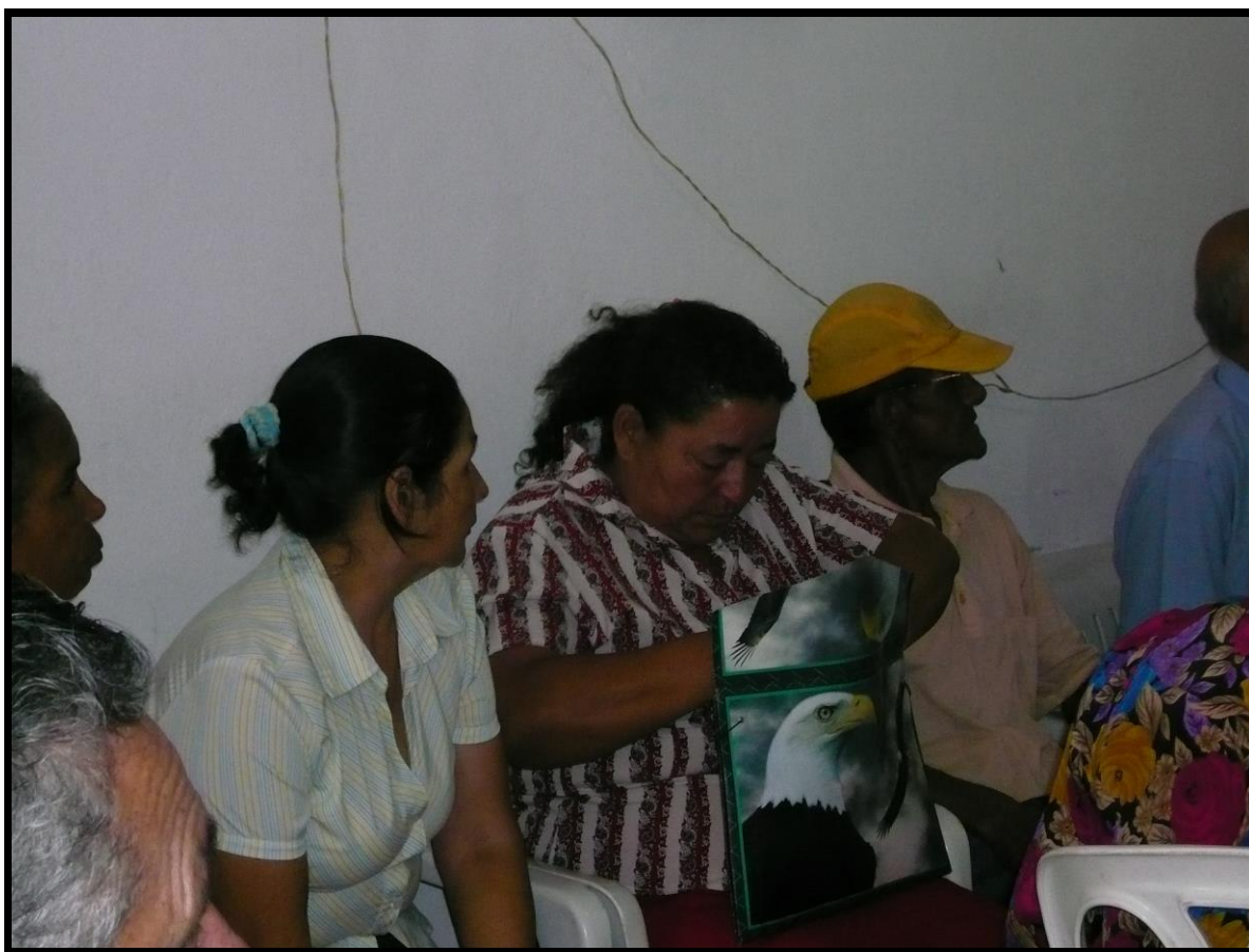
Foto No. 14 Personas desplazadas en la sede de SOLIVIDA

Se hizo la caracterización que se presenta en documento anexo al presente informe.