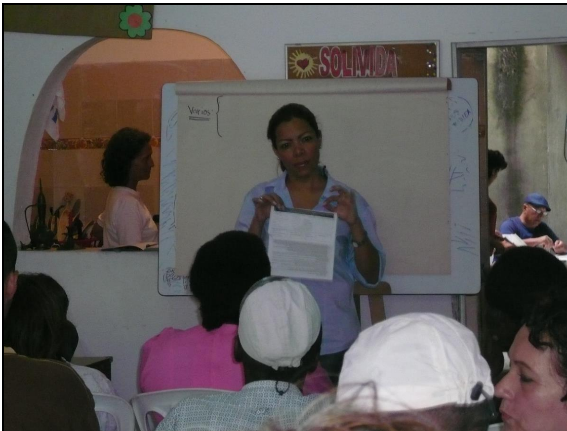
Foto No. 4 Reunión con proyecto Tierras de Acción Social en SOLIVIDA

Se continuó con lo que se planteó en la etapa anterior del proyecto y que fue: