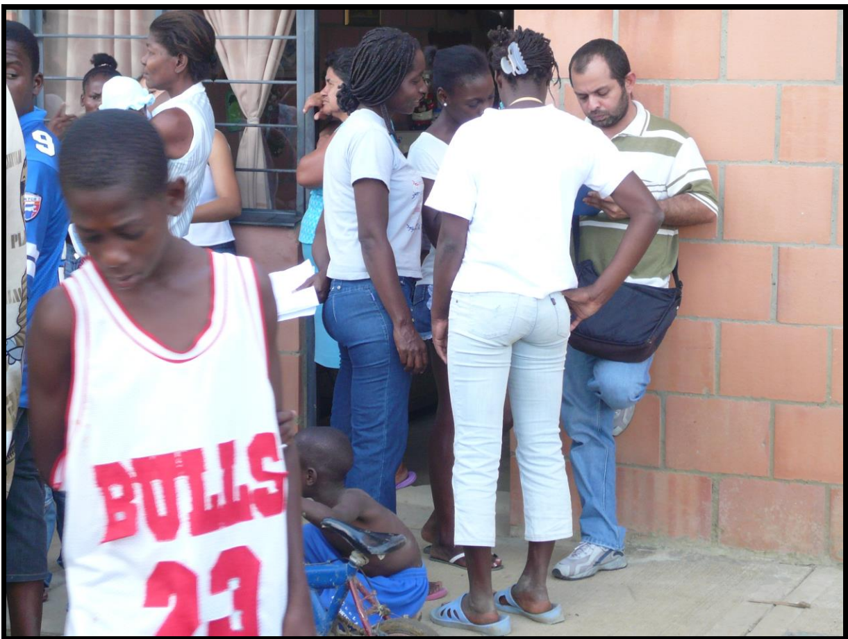
Foto No. 8 reunión de orientación a familias en Potrero grande

La orientación a la población desplazada sobre sus derechos se hace en las atenciones individuales y en las atenciones colectivas así como también en los talleres y en las visitas que se hacen a los sectores donde se encuentran viviendo estas familias desplazadas como son: El Centro Daniell Guillard donde aún quedan unas familias desplazadas viviendo, el jarillón del río Cauca donde también viven algunas familias y Potrero Grande donde están siendo reubicadas las familias que viven en sectores de invasión.