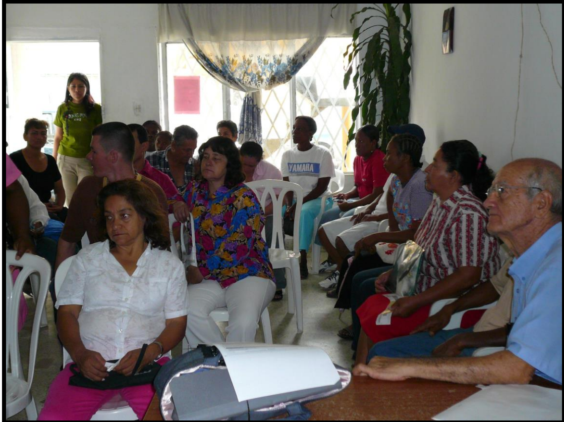
Foto No. 5 reunión en SOLIVIDA con familias que dejaron tierras para proteger

internacionales; estas reuniones se hicieron en la sede de SOLIVIDA los días 23 de Noviembre de 2007 a las 2 PM y 14 de Diciembre de 2007 a las 2.00 PM. (Anexo al presente informe se presentan las constancias de asistencia.