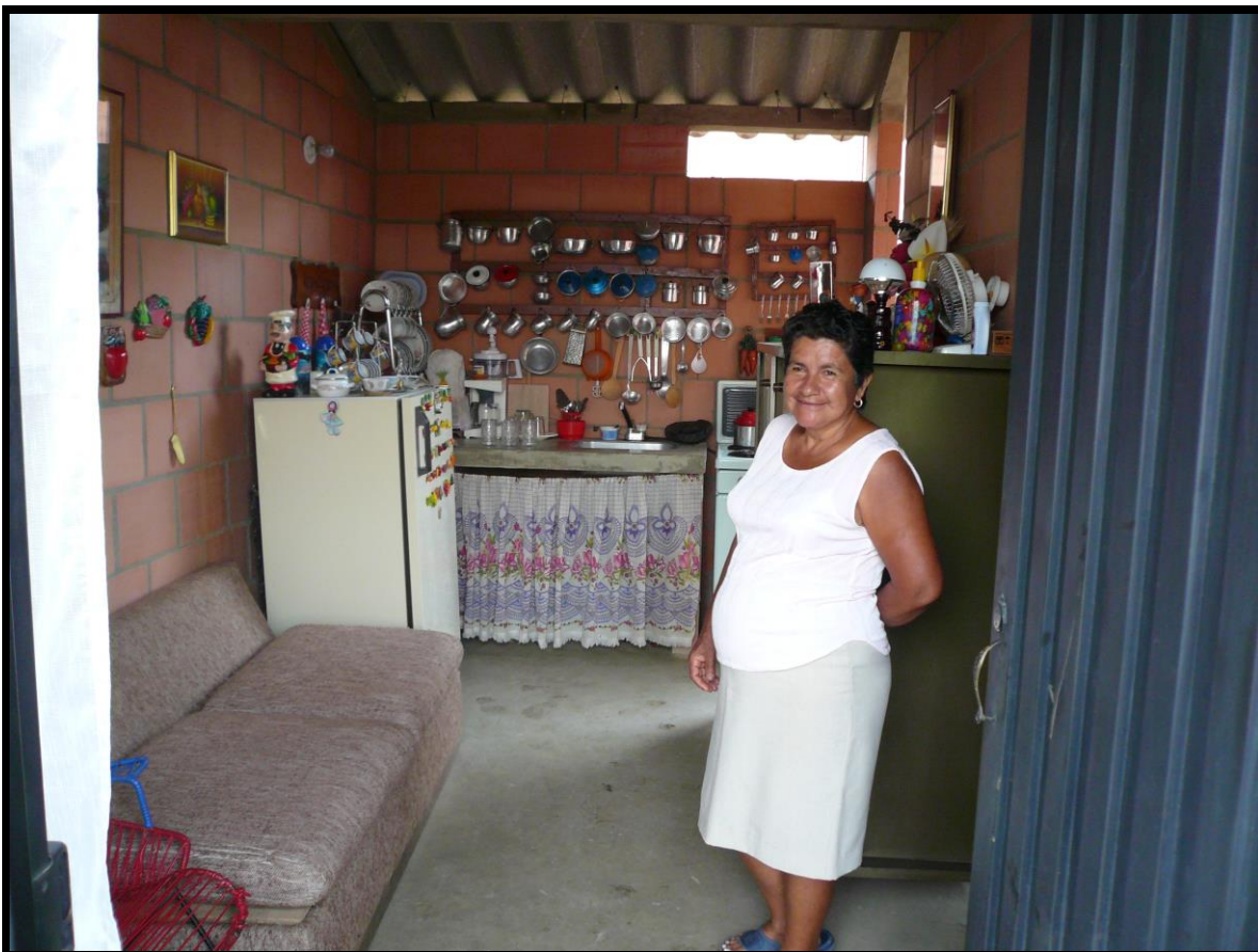
Foto No. 12 casa de mujer desplazada de Restrepo – Valle; en Potrero Grande – Comuna 21