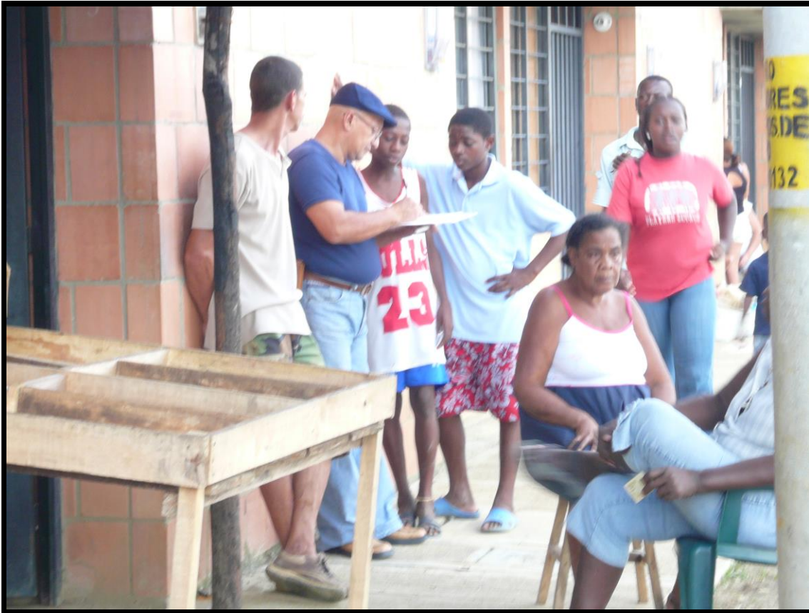
Foto No. 10 tención de población desplazada en Potrero Grande

La mayoría de los casos remitidos fueron: