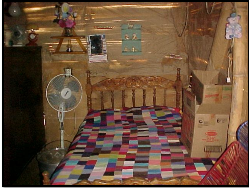
Fotos de vivienda de mujer desplazada de Restrepo Valle a Cali.

En medio de los conflictos intrafamiliares y en muchos casos de hacinamiento, aparece como recurso el sentimiento de la permanencia en unión. Contrario a lo que exigen los idearios de la vida urbana frente a la salida del hogar como independencia de los hijos, en muchas familias los hijos jóvenes continúan viviendo con sus padres, esto se podría leer como una situación forzada obligada por carencia de recursos. La familia reúne todos sus recursos para solucionar de manera conjunta los problemas de la vida cotidiana.